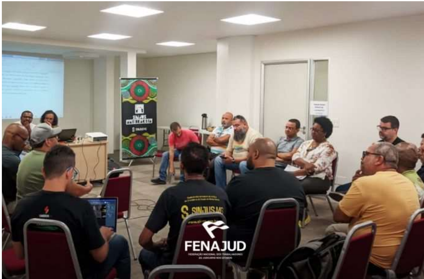
Fenajud instala seu Coletivo de Negras e Negros