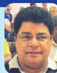
CELSO FERNANDES COMUNICAÇÃO E IMPRENSA