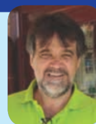
EUGÊNIO FERNANDO CULTURA E ESPORTES